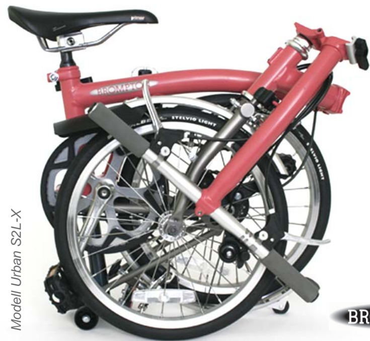
Modell Urban S2L-X