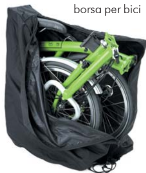
borsa per bici

Manubrio P, manubrio a due prese (alta o laterale). È 2 cm più alto del manubrio M.